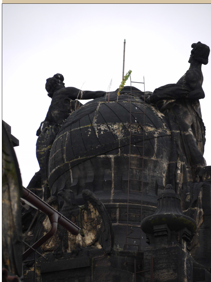
Stav v roce 2017