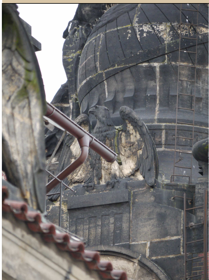
Stav v roce 2017