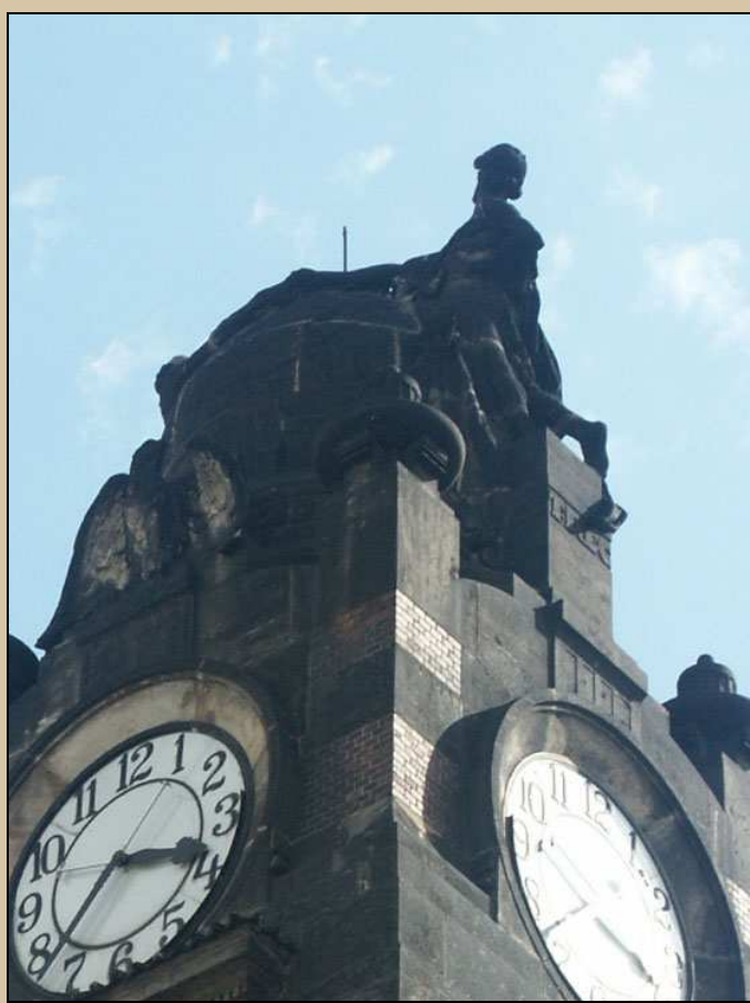
pohled na sochu gigantů od severozápadu