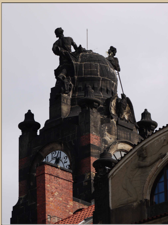
Stav v roce 2017